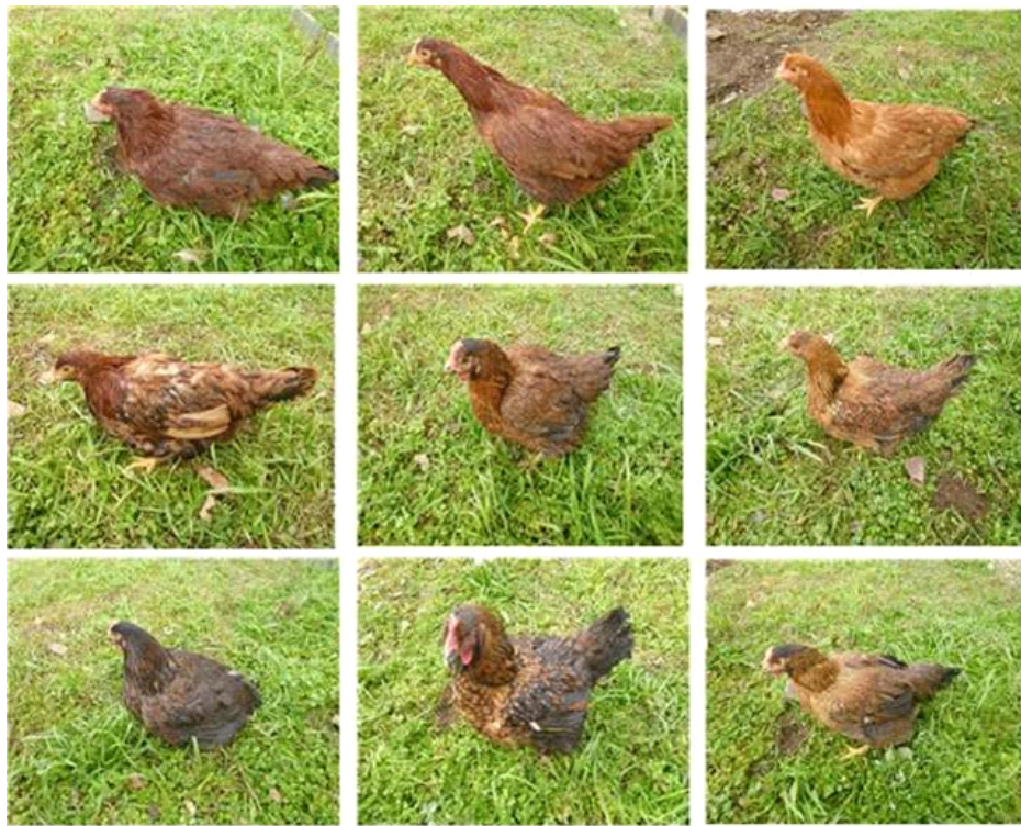
Fig. 1. The representative feather colors of Korean native chicken parent stock combinations

모든 교배조합에서 개체들의 벗 모양은 단관으로 나타났다. 교배조합 간 개체별 깃털 색의 변이는 그리 크지 않은 것으로 나타났는데, 크게 황갈색 및 적갈색과 이들 색 간의 혼합 양상이 대부분이었다. 조합별 16주령 깃털 색의 발현 양상을 Fig. 1에 제시하였고, 이들의 분포 빈도를 Table 2에 정리하였다. 분석 결과, 황갈색 및 적갈색의 단일 깃털 색만