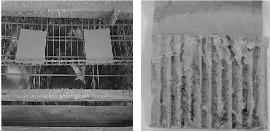
Fig. 1. Cardboard trap of red mite (closed and opened).

사, 호흡기 증상, 침울 및 설사증상을 조사하였다. 1차 살포를 마친 후 7일까지 상태를 조사하였고, 다시 2차 살포를 하여 14일까지의 이상증상을 확인하였다.