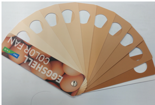
Fig. 1. Eggshell color fan (Nonghyup eggshell color fan, Korea Poultry Cooperative, Korea).

(Model No. 547-360, Mitutoyo Co. Ltd., Japan)를 이용하여 측정하였다.